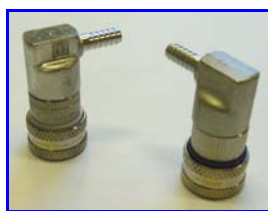
Coupleurs à billes inox (option)