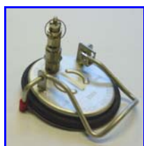
Couvercle avec soupape de décharge