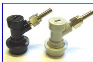
Coupleurs à billes plastique (option)